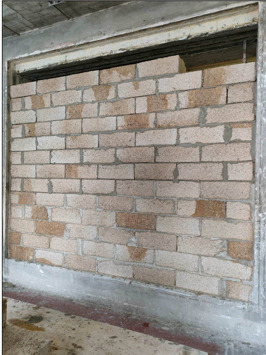
Fotografia dell'oggetto durante la costruzione

Photograph of item during the construction